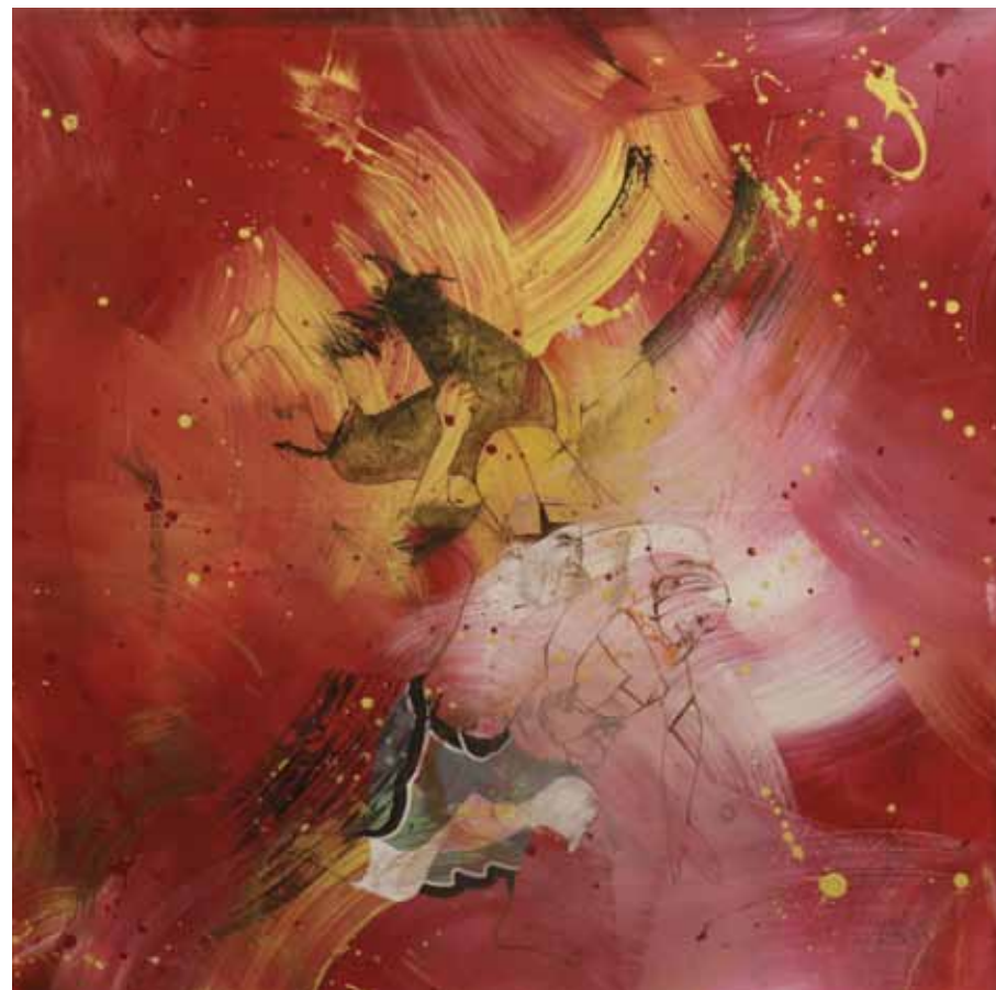
پایان پهلوانی | ۱۳۹۶ | اکریلیک روی بوم | ۱۲۰×۱۲۰cm

The Sacrificed and The Authority | 2017 | Acrylic on canvas | 150×150cm