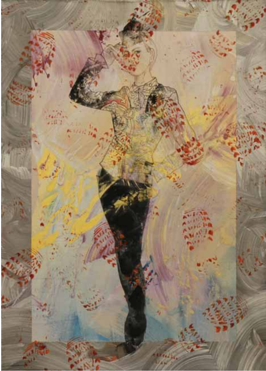
اغواگر | ۱۳۹۶ | اکریلیک روی بوم | ۱۴۰×۱۰۰cm

Femme Fatale | 2017 | Acrylic on canvas | 140×100cm