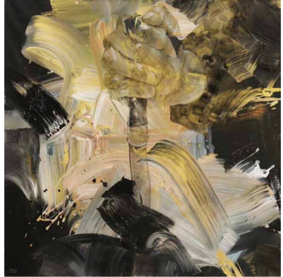
شکوه رنج | ۱۳۹۶ | اکریلیک روی بوم | ۱۵۰×۱۵۰cm

The New Generation | 2017 | Acrylic on canvas | 150×150cm