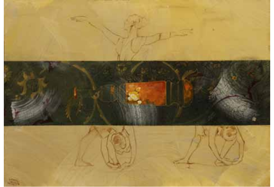
دگا! کمی کشیده‌تر | ۱۳۹۶ | اکریلیک روی بوم | ۷۰×۱۰۰cm

Femme Fatale | 2017 | Acrylic on canvas | 140×100cm