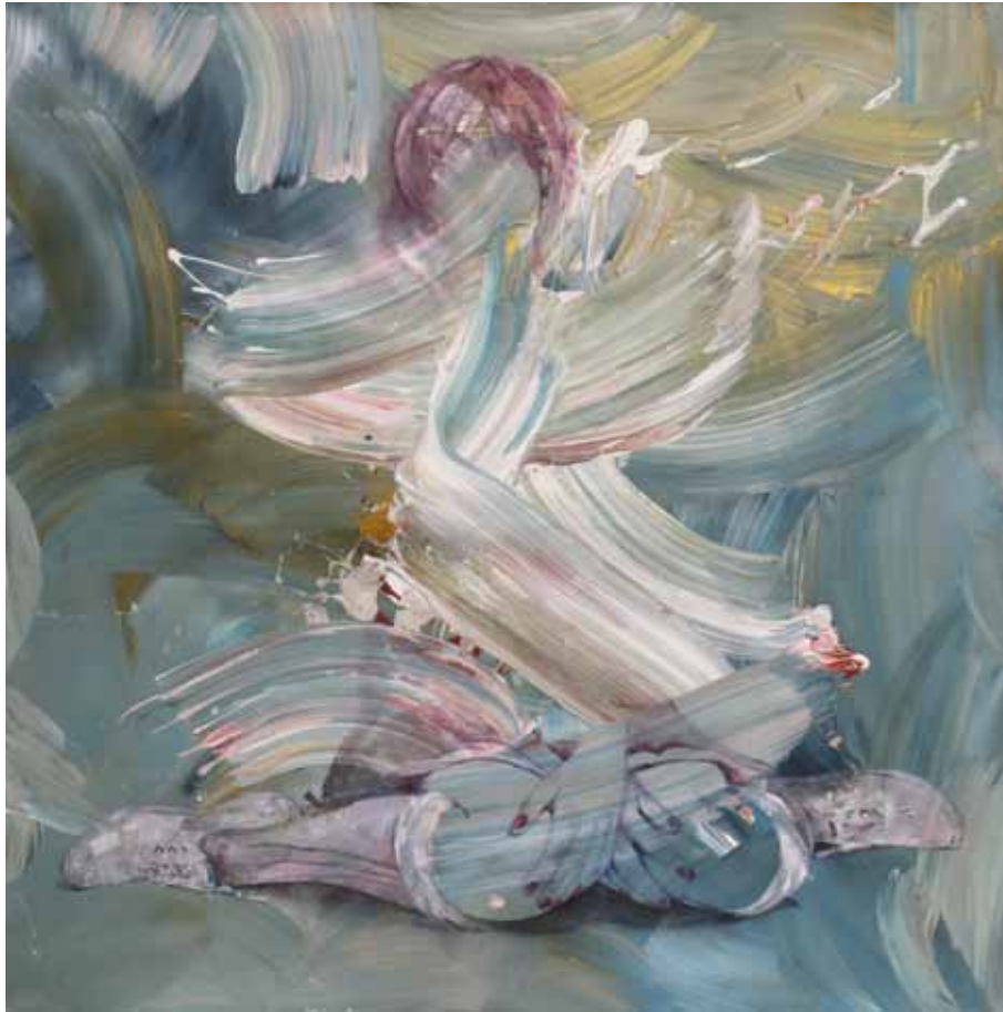
نسل نو | ۱۳۹۶ | اکریلیک روی بوم | ۱۵۰×۱۵۰cm

The New Generation | 2017 | Acrylic on canvas | 150×150cm