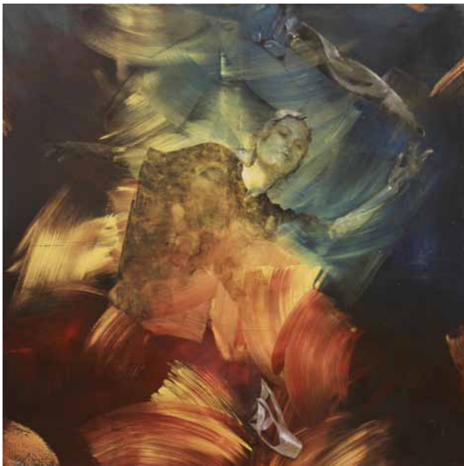
قربانی و اقتدار | ۱۳۹۶ | اکریلیک روی بوم | ۱۵۰×۱۵۰cm

The Sacrificed and The Authority | 2017 | Acrylic on canvas | 150×150cm