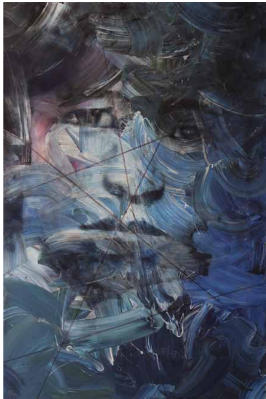
کاوہ آهنگر | ۱۳۹۶ | اکریلیک روی بوم | ۲۷۰×۱۸۰cm

Dicapitation of Saeed Ibn Yahya | 2017 | Acrylic on canvas | 200×140cm