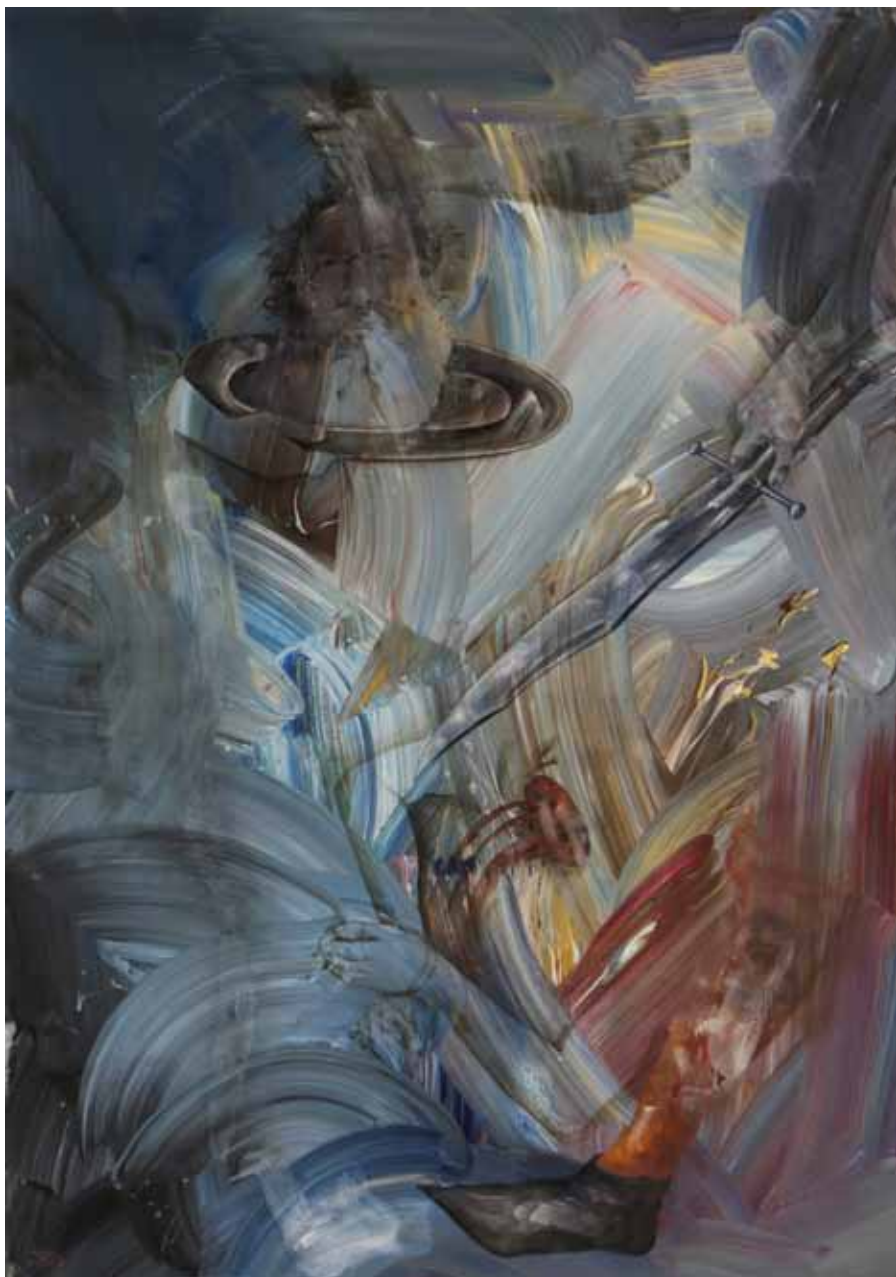
سر بریده سعید بن یحیی | ۱۳۹۶ | اکریلیک روی بوم | ۲۰۰×۱۴۰cm

Dicapitation of Saeed Ibn Yahya | 2017 | Acrylic on canvas | 200×140cm