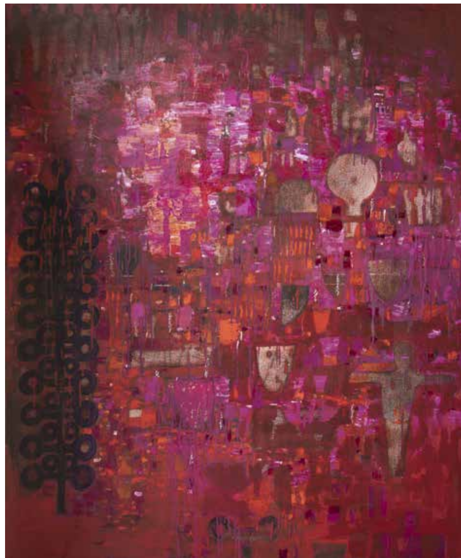
بدون عنوان | ۱۳۹۷ | اکریلیک روی بوم | ۱۴۵×۱۱۵cm Untitled | 2018 | Acrylic on canvas | 145×115cm