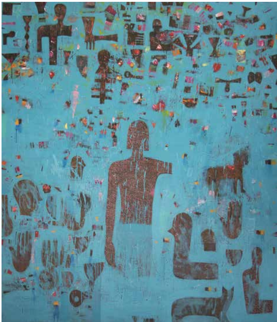
بدون عنوان | ۱۳۹۷ | اکریلیک روی بوم | ۱۶۰×۱۴۰cm Untitled | 2018 | Acrylic on canvas | 160×140cm