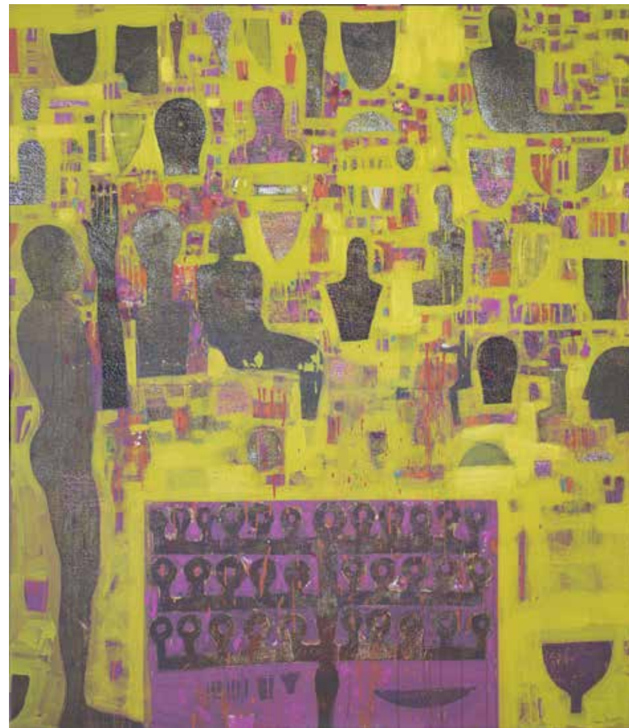
بدون عنوان | ۱۳۹۸ | اکریلیک روی بوم | ۱۶۰×۱۴۰cm Untitled | 2019 | Acrylic on canvas | 160×140cm