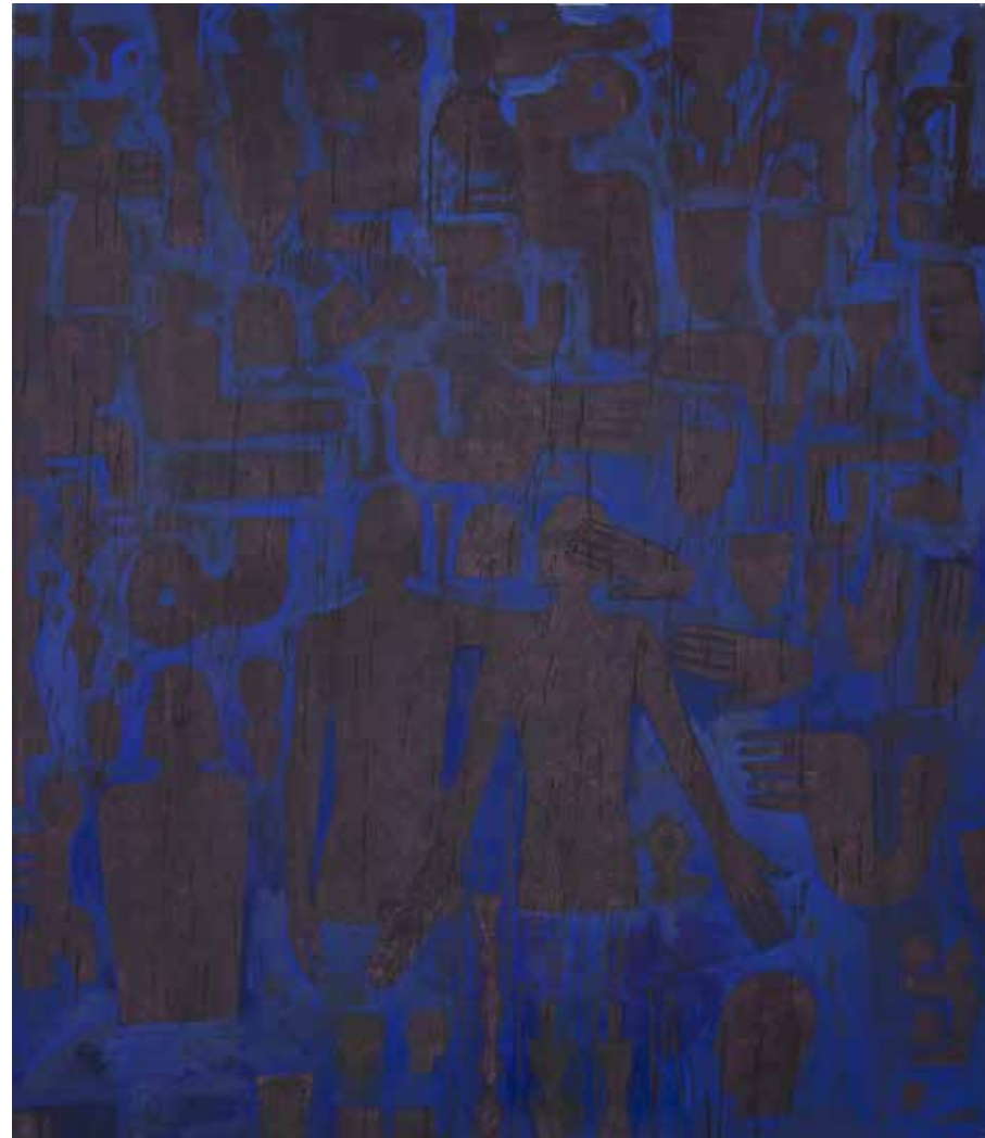
بدون عنوان | ۱۳۹۸ | اکریلیک روی بوم | ۱۶۰×۱۴۰cm Untitled | 2019 | Acrylic on canvas | 160×140cm