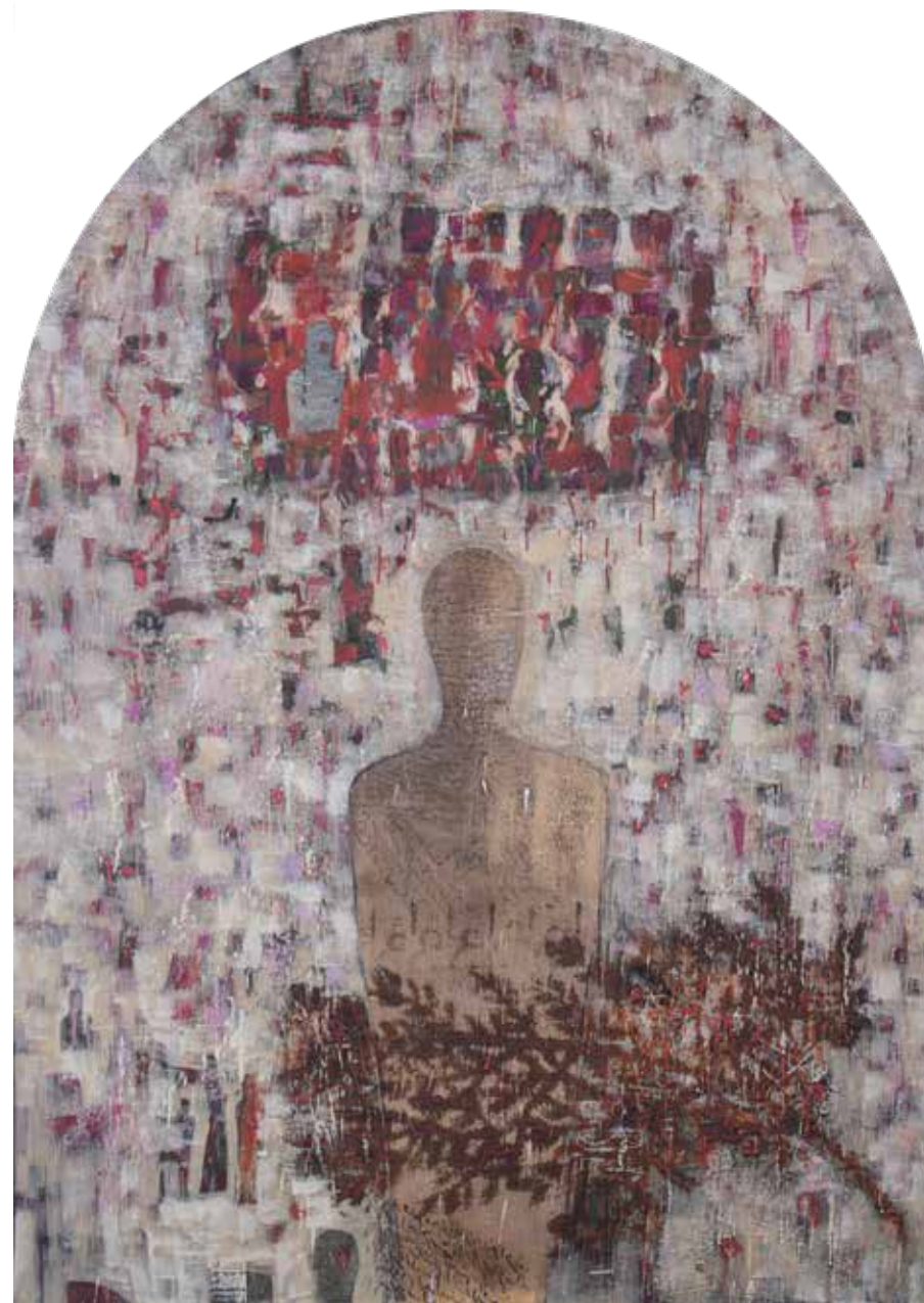
بدون عنوان | ۱۳۹۷ | آکریلیک روی بوم | ۱۷۰×۱۲۰cm Untitled | 2018 | Acrylic on canvas | 170×120cm