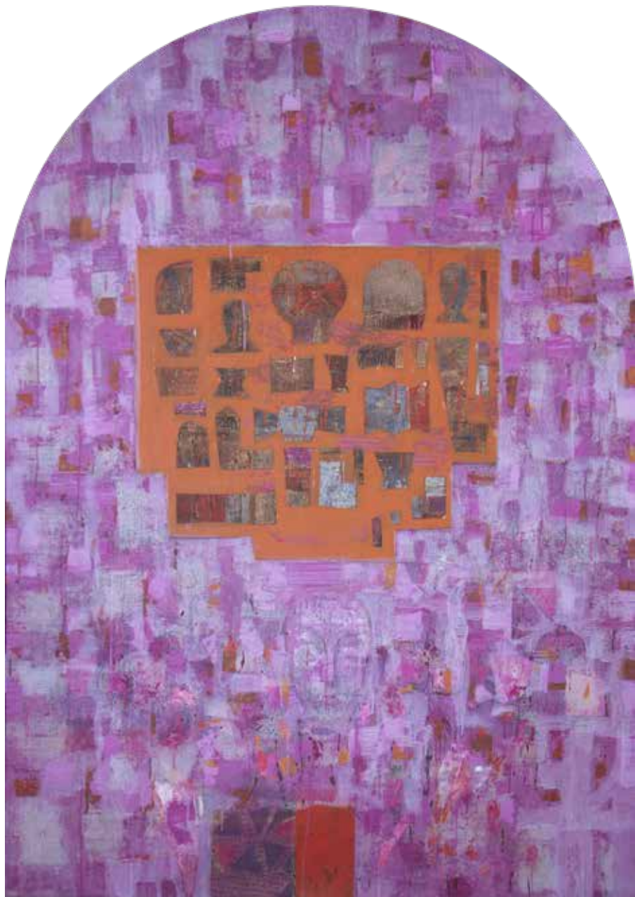
بدون عنوان | ۱۳۹۷ | آکریلیک روی بوم | ۱۷۰×۱۲۰cm Untitled | 2018 | Acrylic on canvas | 170×120cm