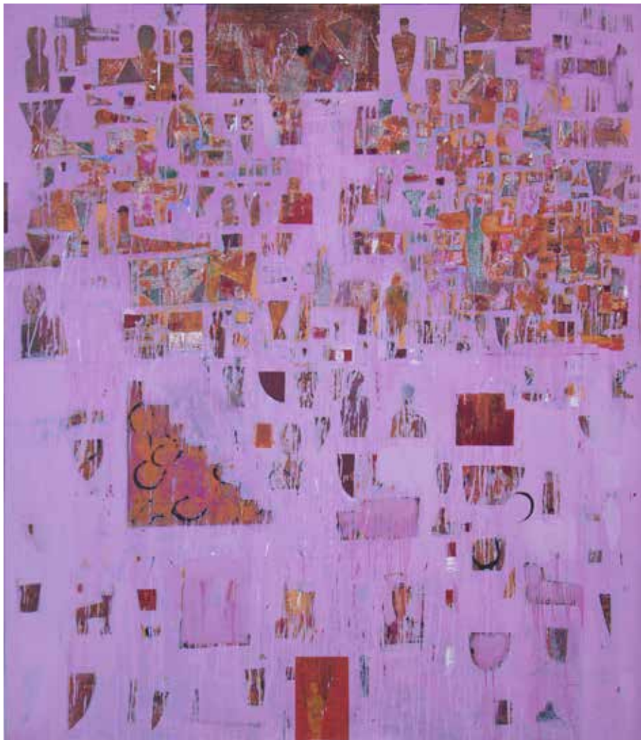
بدون عنوان | ۱۳۹۸ | اکریلیک روی بوم | ۱۶۰×۱۴۰cm Untitled | 2019 | Acrylic on canvas | 160×140cm