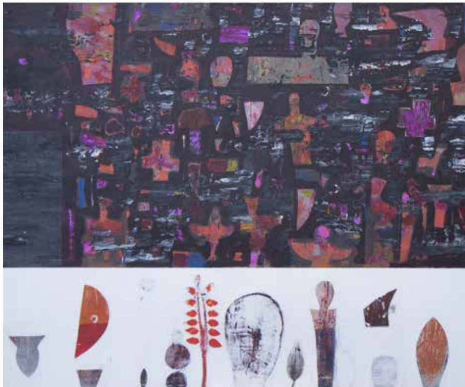
بدون عنوان | ۱۳۹۷ | اکریلیک روی بوم | ۱۰۰×۱۲۰cm Untitled | 2018 | Acrylic on canvas | 100×120cm