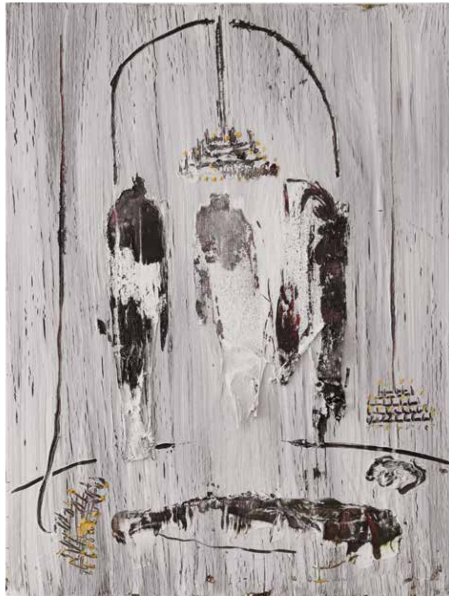
بدون عنوان | ۱۳۹۸ | اکریلیک و رنگ روغن روی بوم | ۴۰×۳۰cm Untitled | 2019 | Oil and acrylic on canvas | 40×30cm