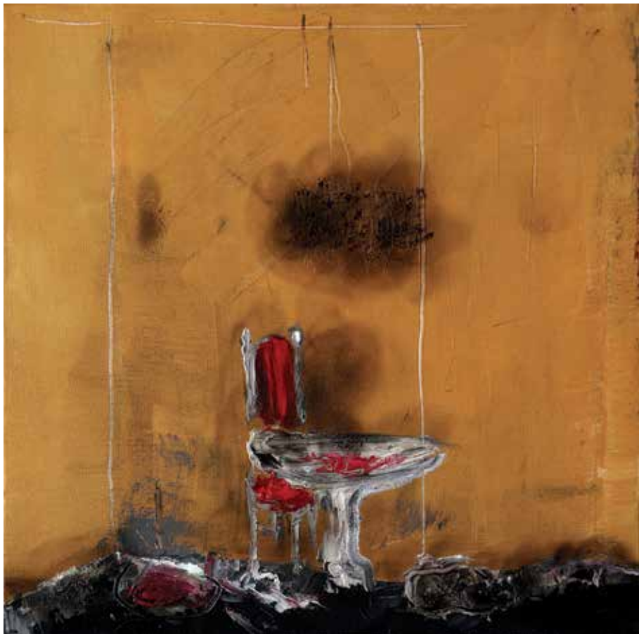
اتاق پاپ | ۱۳۹۸ | رنگ روغن روی بوم | ۳۰×۳۰ cm Papal Room | 2019 | Oil on canvas | 30×30cm