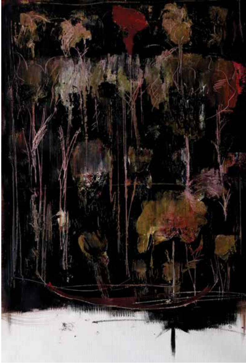
گل ها | ۱۳۹۸ | رنگ و روغن و اکریلیک روی بوم | ۸۵×۷۰cm Flowers | 2019 | Oil and acrylic on canvas | 85×70cm