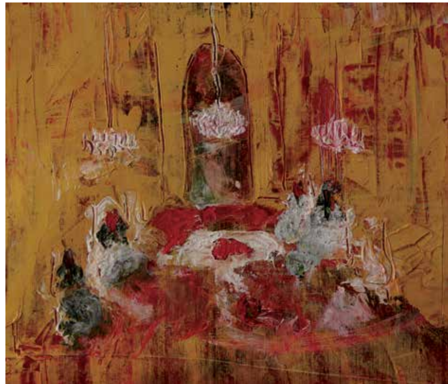
بدون عنوان | ۱۳۹۸ | رنگ روغن روی بوم | ۵۰×۴۰ cm Untitled | 2019 | Oil on canvas | 50×40cm